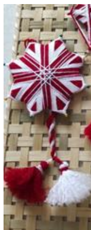
рис № 5

2.2 Собрать готовое изделие «Мартеничка», украсить кисточками красного и белого цвета.