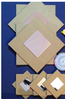
рис № 2

1.1. Первое, на что нужно обратить внимание, картон должен быть гофрированный и иметь точную фигуру квадрата в количестве 2 штук, накладывая друг на друга склеиваем со смещением углов. Вставить по углам булавки. (рис.№3)